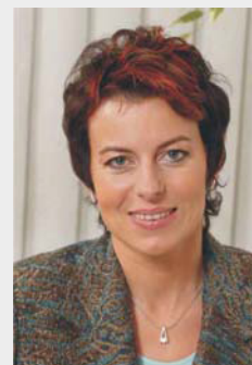
ÚVODNÍ SLOVO ŘEDITELKY SPOLEČNOSTI

Vážení klienti, milí čtenáři, jarní měsíce, které se příliš jasně netvářily, utekly jako voda a my se vám hlásíme s naším letním newsletterem. Opět bychom se s vámi rádi podělili o novinky v Mojí ambulanci.